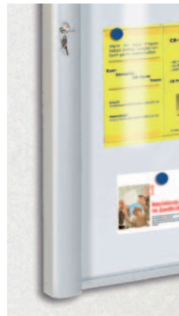
Support d'affichage CARTBOX

Unité : mm - h : horizontal / v : vertical