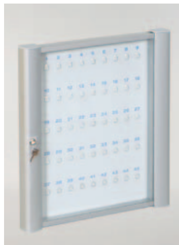
Vitrine pour clefs (550 x 496 mm)