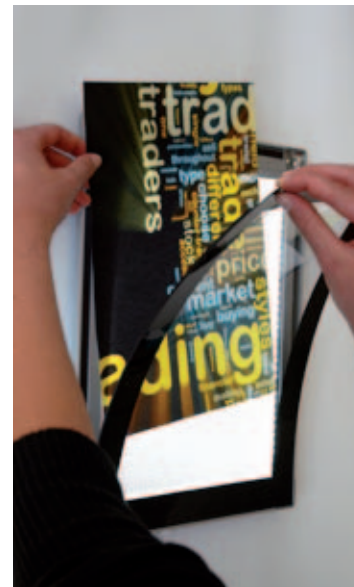
Support d'affichage LUMO

Unité : mm - h : horizontal / v : vertical