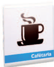
Plaque de Porte